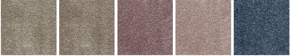
MOMENTS 48 MOMENTS 49 MOMENTS 66 MOMENTS 68 MOMENTS 75