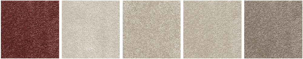
MOMENTS 12 MOMENTS 30 MOMENTS 32 MOMENTS 34 MOMENTS 40