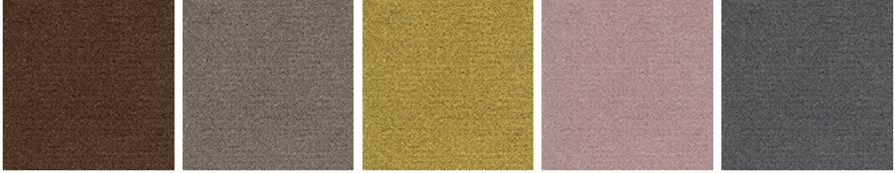
TRIUMPH 44 TRIUMPH 49 TRIUMPH 54 TRIUMPH 67 TRIUMPH 79