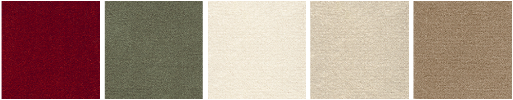
TRIUMPH 10 TRIUMPH 29 TRIUMPH 30 TRIUMPH 34 TRIUMPH 37